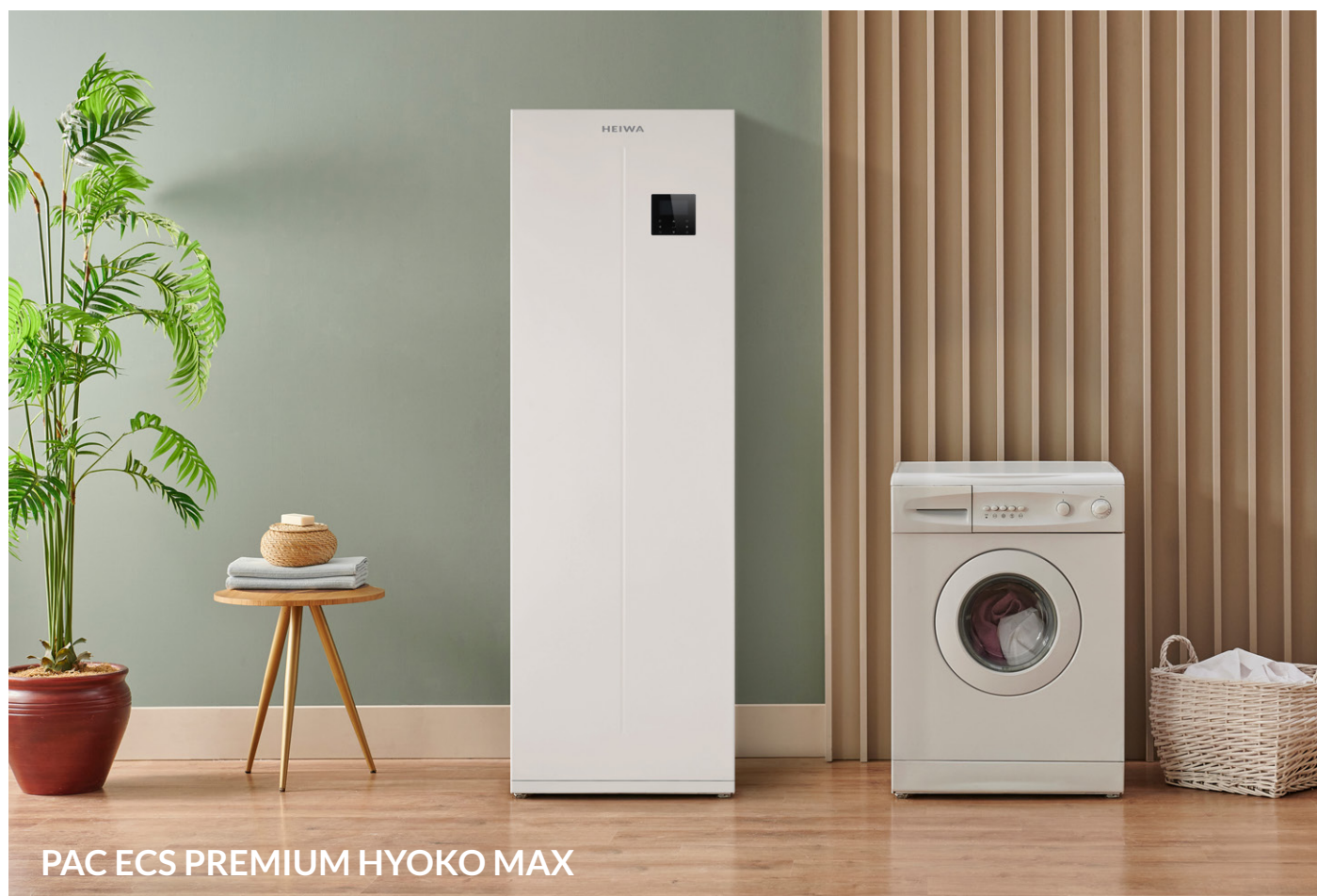
PAC ECS PREMIUM HYOKO MAX

Pour simplifier son utilisation, la PAC Air/Eau HEIWA se contrôle grâce à une télécommande 100 % en français qui permet de programmer les périodes de chauffage souhaitées ainsi qu'une option « absence longue durée » permettant de réaliser des économies d'énergies.