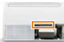
Emplacement courant du boîtier électrique

Le boîtier électrique se trouve sur le côté gauche de l'appareil pour un accès facile sans avoir à démonter les turbines lors de la maintenance.