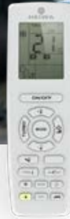
Télécommande HPVOIR-V1 incluse