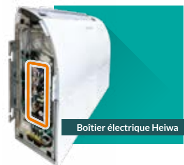
Boîtier électrique Heiwa